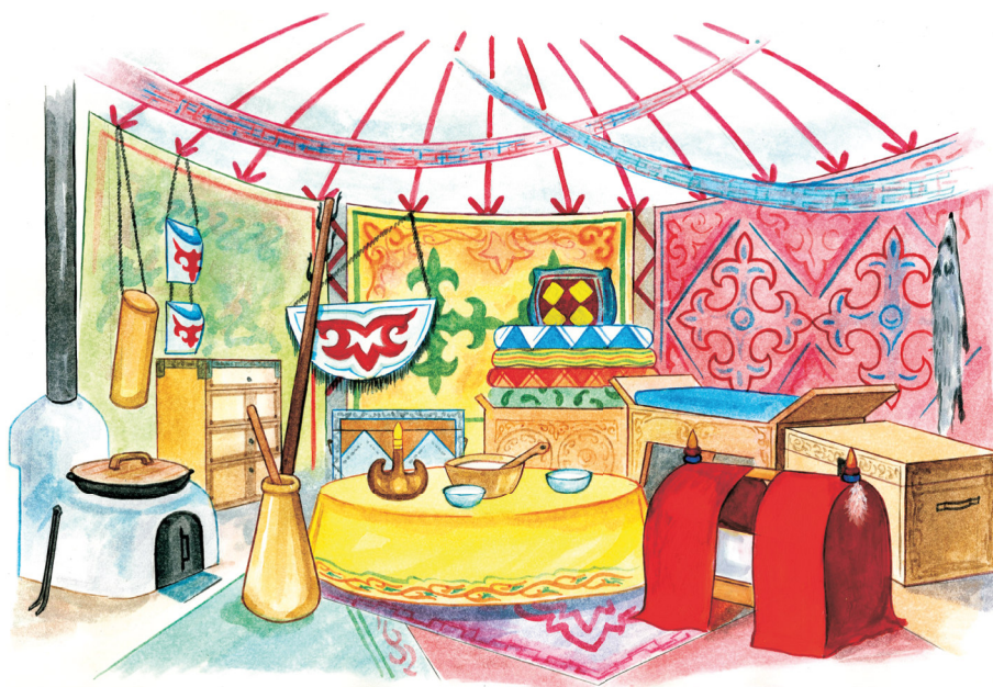
1-сурет – Киіз үй жабдыктары

Зерттеу жұмысы 3 құрамдас кезеңдерден тұрды: