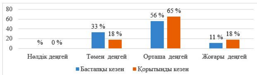
2-сурет. Әлеуметтік педагогика сабақтарында тест тапсырмаларды қолдану кезінде студенттердің танымдық белсенділігінің даму динамикасы

тапсырмалар әртүрлі нақты ақпаратты тиімді бағалауға жағдай туғызады. Сонымен қатар олар қарапайым және объективті өңдеумен сипатталады.